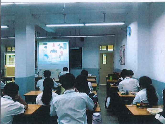
地點：各教室 時間：112年9月7日中午用餐時間 說明：第2次撥放國家防災日宣導影片供師生收視