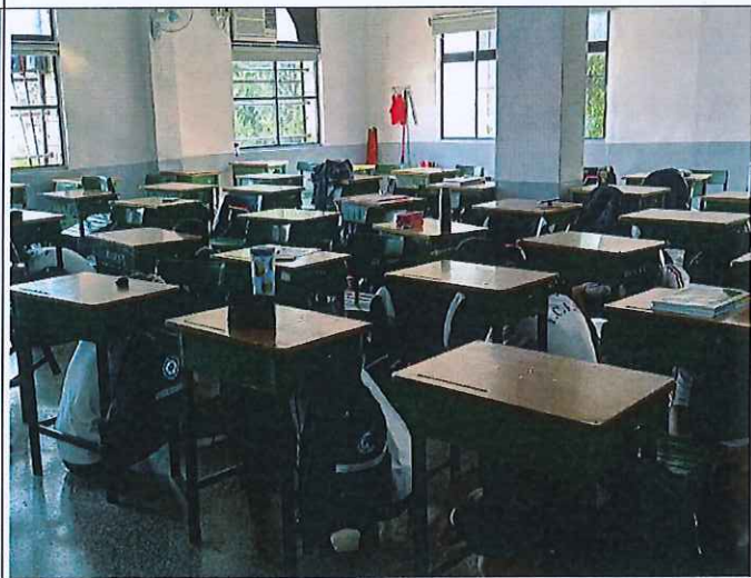
地點：各教室、各場地 時間：112年9月14日中午用餐時間 說明：配合國家防災日全國統一警報測試實施預演