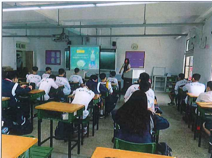
地點：各教室 時間：112年9月6日中午用餐時間 說明：第1次撥放國家防災日宣導影片供師生收視