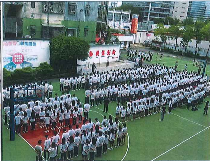
地點：操場司令台 時間：112年9月7日週會 說明：由校長說明宣導國家防災日演練活動