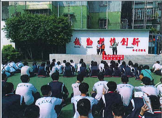
地點：全校 時間：112年9月21日 說明：正式演練於疏散安全位置由學務主任宣導講解緊急避難包使用。